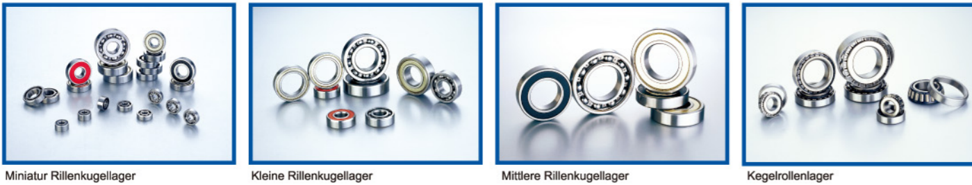
Miniatur Rillenkugellager Kleine Rillenkugellager Mittlere Rillenkugellager Kegelrollenlager